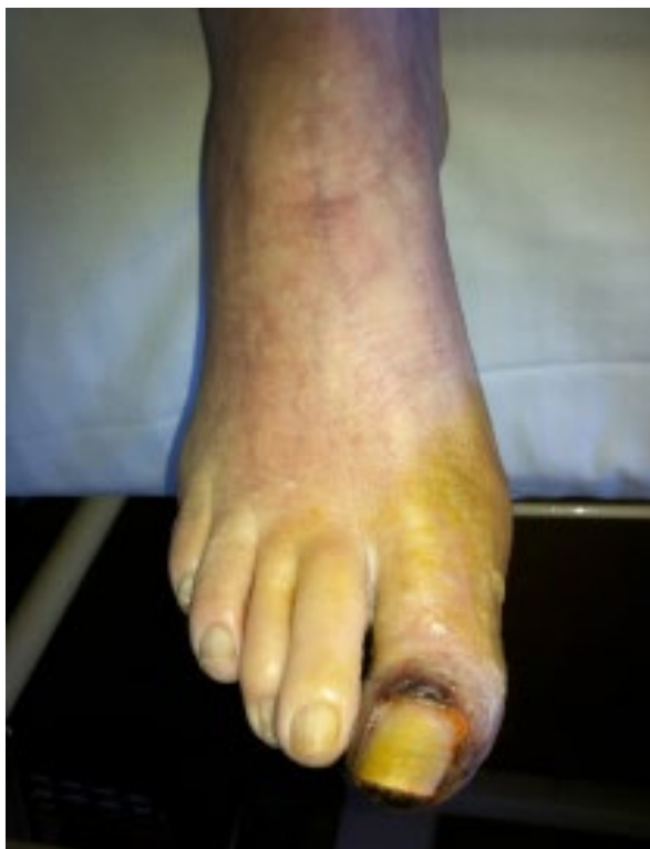
Imagen 6: Isquemia crónica grado IV de La Fontaine

Se incluyen en este capítulo aquellas úlceras relacionadas con la arteriopatía obstructiva crónica en sus fases avanzadas (isquemia crítica de la extremidad) según la clasificación de Rutherford (grados 4, 5 o 6) y la más empleada en nuestro medio, la clasificación de La Fontaine (grados III y IV) 17, 24 ( imagen 6 ).