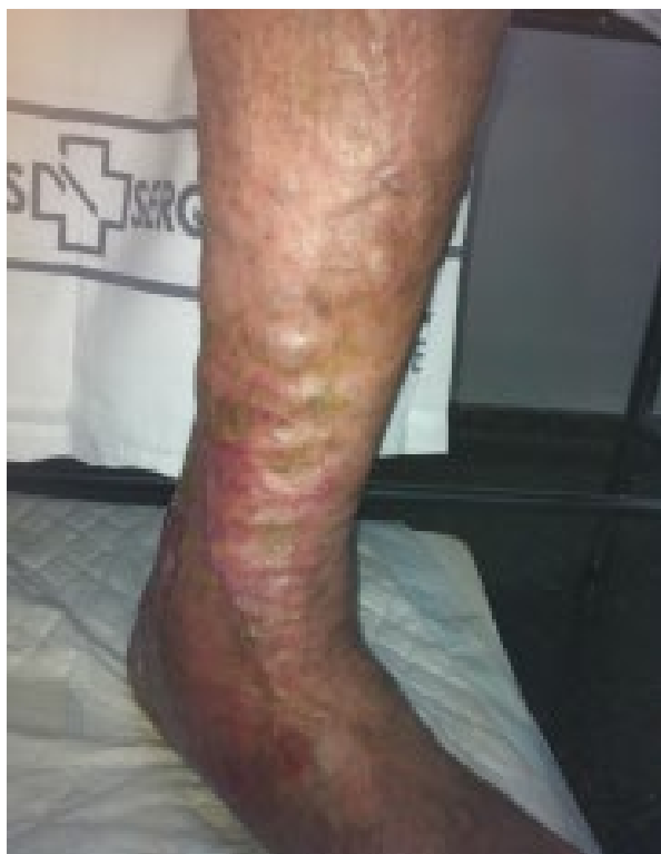
Imagen 2. Insuficiencia venosa crónica grado 6 de la CEAP. Úlcera venosa