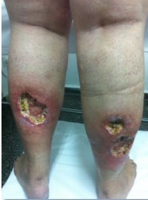
Imagen 1. Úlceras por alteración metabólica congénita: déficit de prolidasa