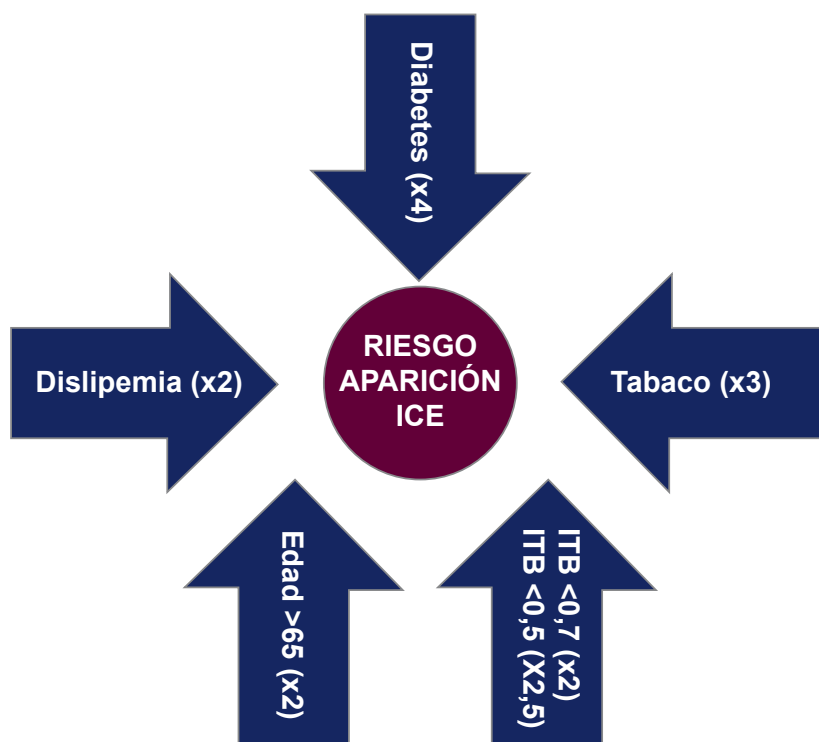
Figura 1. TASC II: etiopatogenia

La magnitud del riesgo de los distintos factores de riesgo sobre el desarrollo de isquemia crítica en pacientes con EAP es variable y aparece representada en el siguiente esquema ( figura 1 ) 24 .