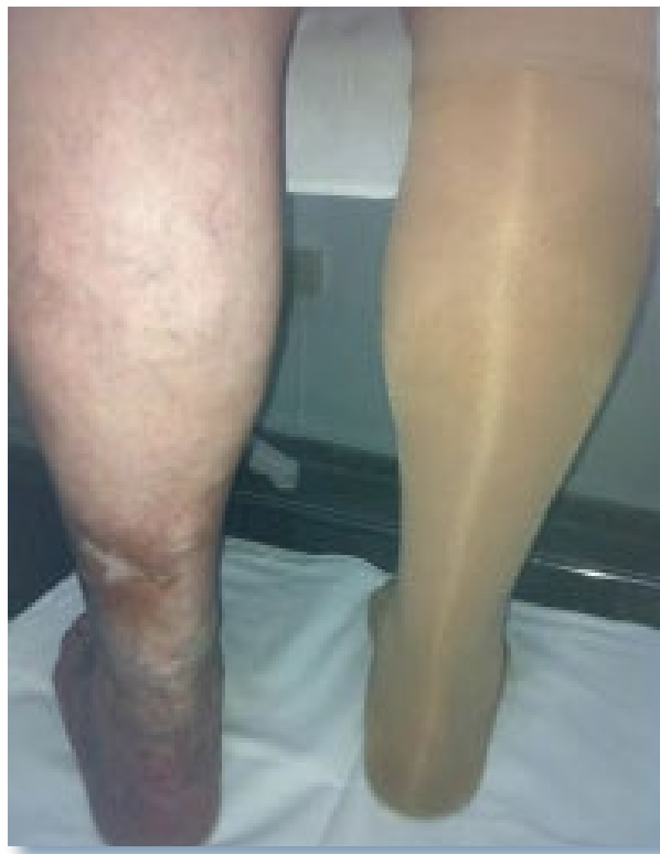
Imagen 3. Media de compresión decreciente en paciente con IVC