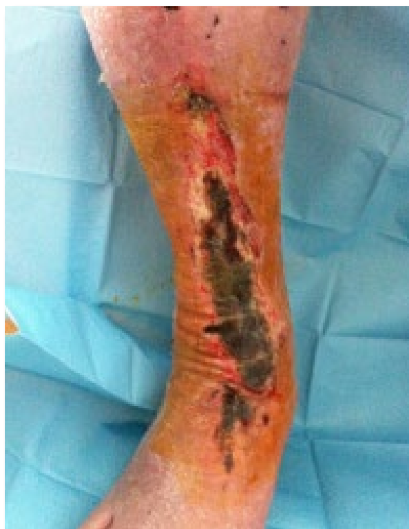
Imagen 5. Isquemia crítica de la extremidad inferior. Úlcera isquémica