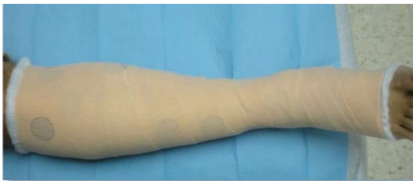
Imagen 4. Vendaje de compresión bicapa

En combinación con el vendaje multicapa, en las úlceras venosas no complicadas se recomienda como apósito primario un apósito sencillo, de baja adherencia, económico y aceptable por el paciente [R] 3 . Una revisión Cochrane concluye que el tipo de apósito aplicado debajo de la compresión no ha demostrado afectar a la cicatrización de las úlceras 20 .